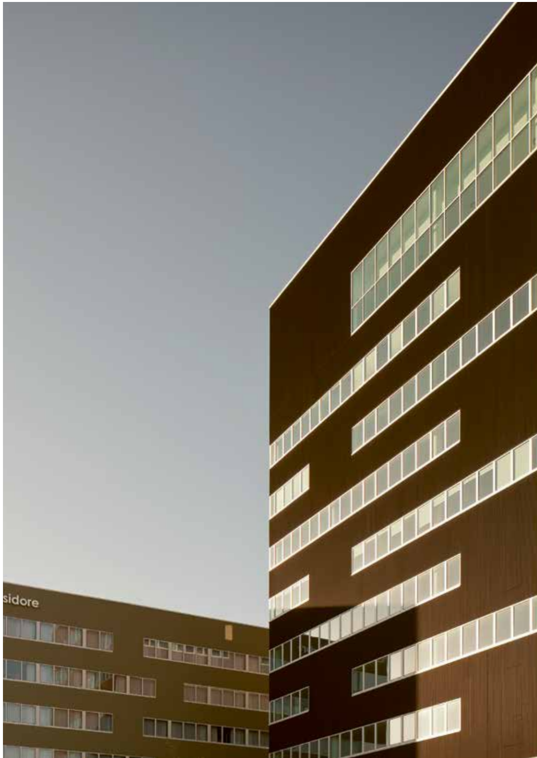
Origami, Barthélémy Griño © Arnaud Schelstraete