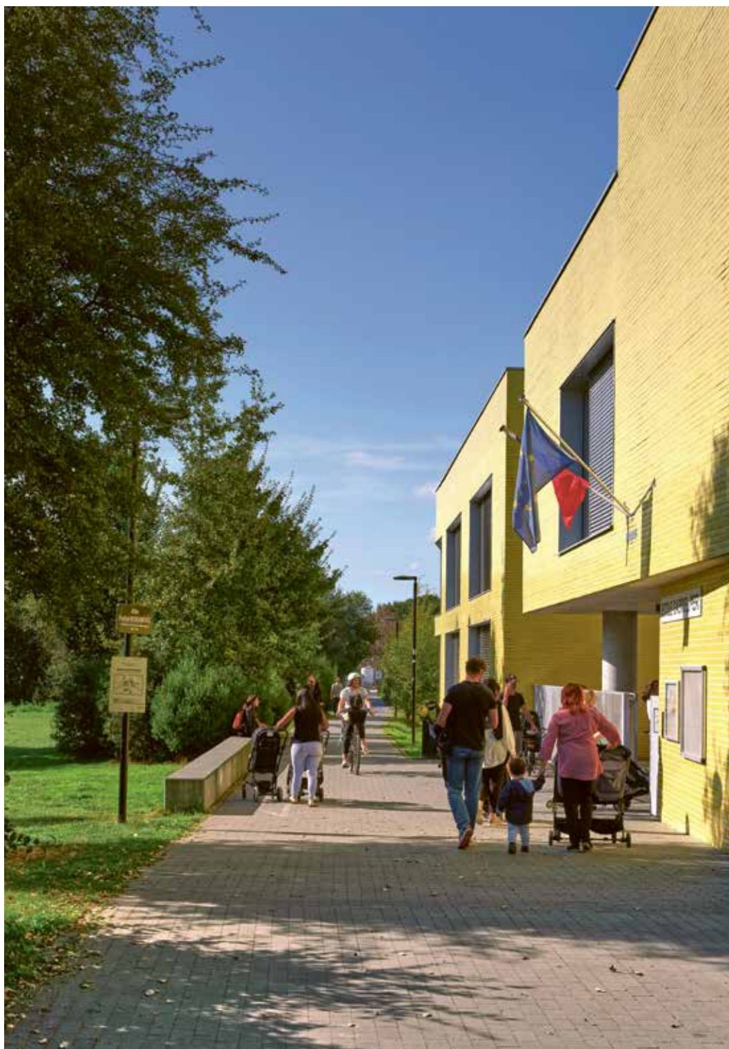
Abords école Gabriel Péri à La Pilate