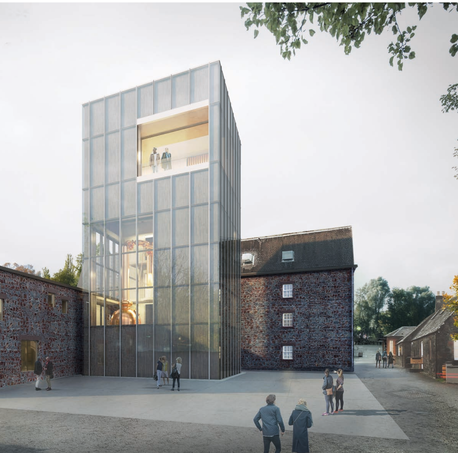
Distillerie Glenmorangie / Tain, Ecosse, 2017 Maîtrise d'ouvrage: The Glenmorangie Company Surface: 1000 m 2 / Coût: NC