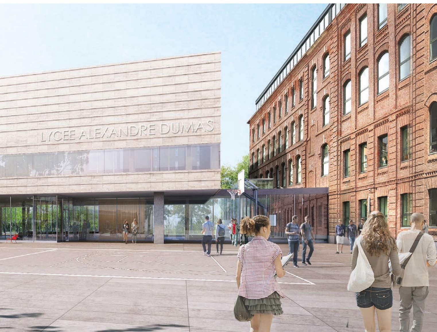
Lycée Français Alexandre Dumas / Moscou, Russie, 2017 Maîtrise d'ouvrage: AEFE Surface: 4 400 m 2 / Coût: NC