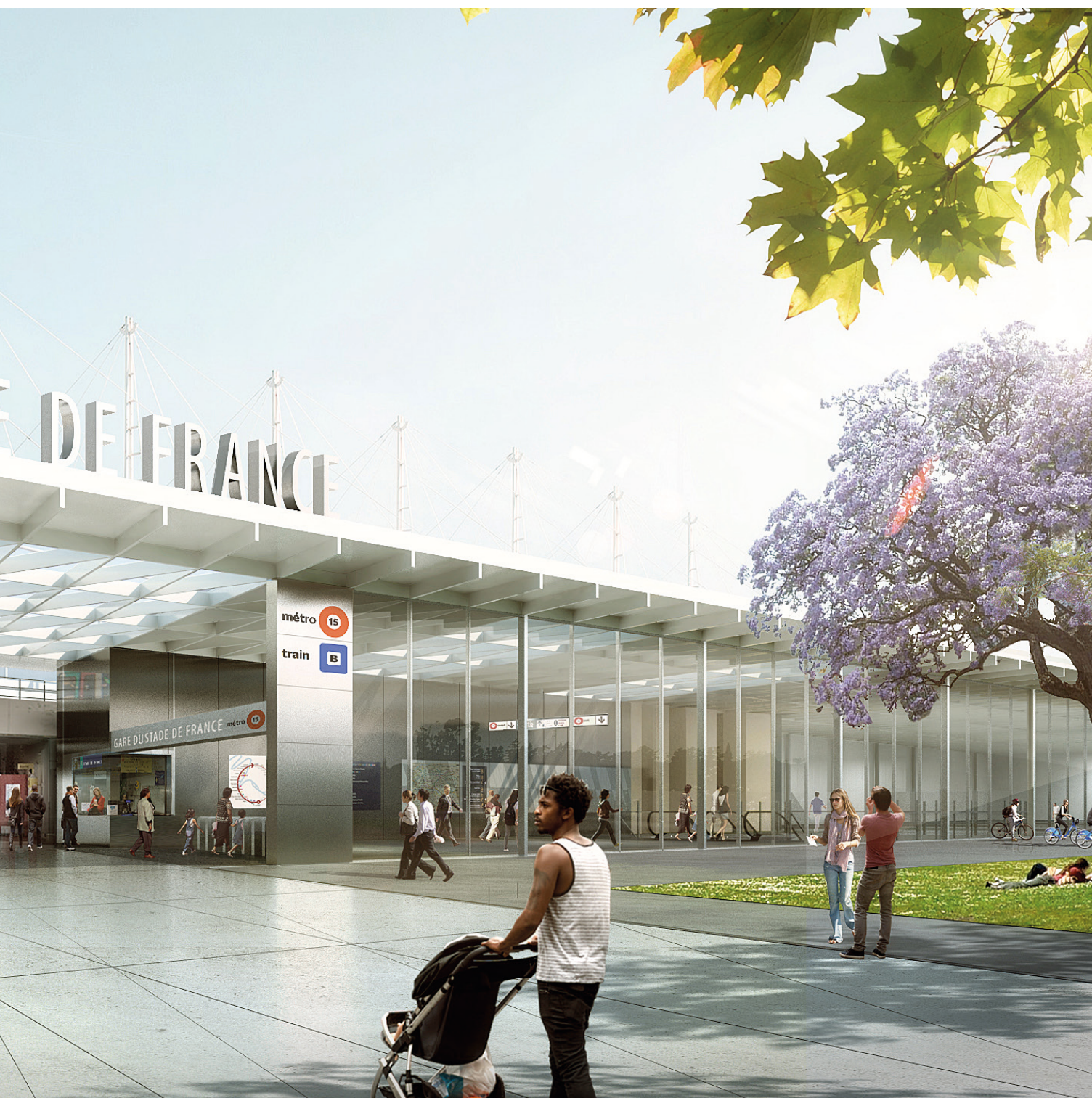
Gare GPE - Stade de France / Paris, France, 2016 Maîtrise d'ouvrage: Grand Paris Express Surface: 13 000 m 2 / Coût: 20 M€ HT Concours