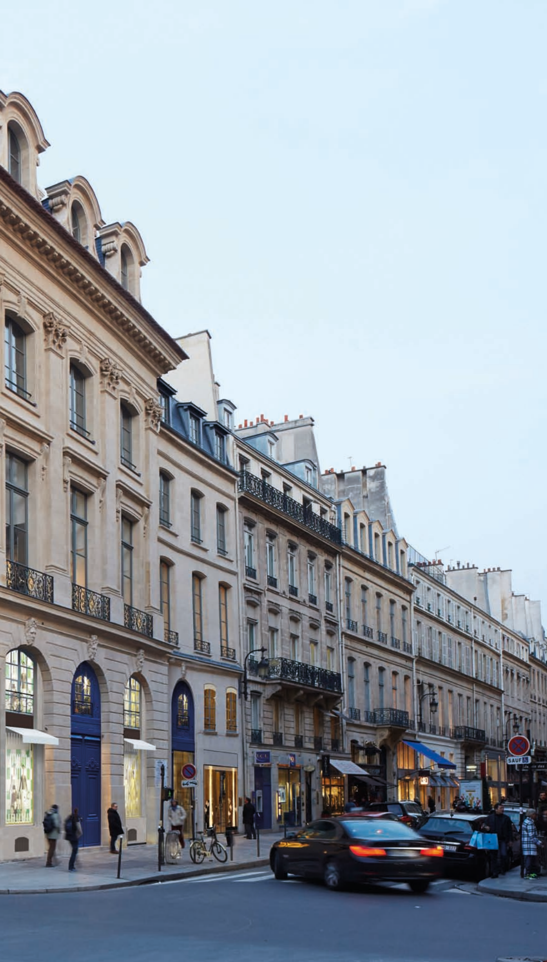
Global store Louis Vuitton Vendôme / Paris, France, 2016 Maîtrise d'ouvrage: LVMH Surface: 3 600 m 2 / Coût: NC