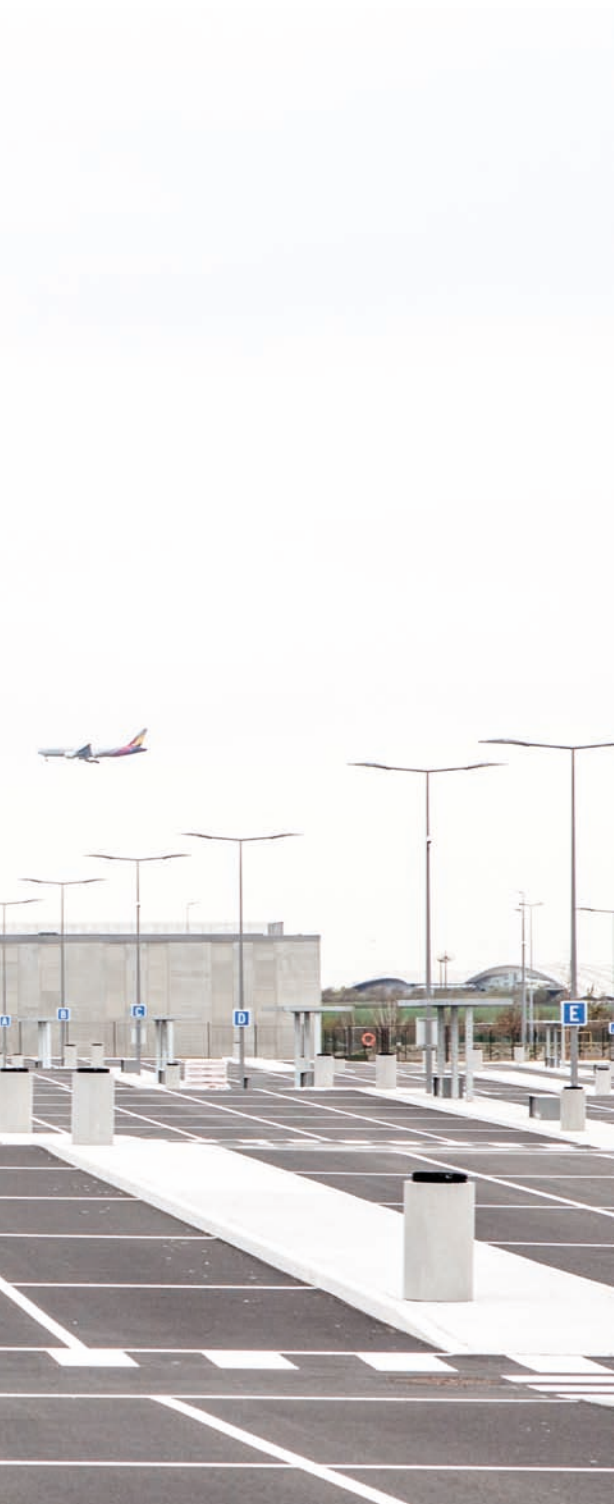
Base de taxis de l'aéroport CDG / Roissy, France, 2016 Maîtrise d'ouvrage: Aéroports de Paris Surface: 6,4 hectares / Coût: 6,3 M€ HT